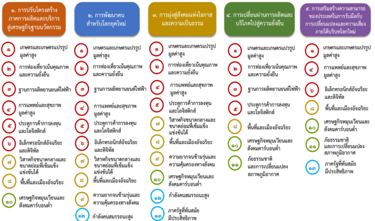
แผนภาพที่ ๓.๑ ความเชื่อมโยงระหว่างหมวดหมู่การพัฒนาที่เป้าหมายหลัก

ความเชื่อมโยงระหว่างหมวดหมู่การพัฒนาที่เป้าหมายหลักแสดงไว้ในแผนภาพที่ 3.1 โดยหมวดหมู่การพัฒนาที่กำหนดขึ้นเป็นประเด็นที่มีลักษณะเชิงบูรณาการที่ครอบคลุมการพัฒนาตั้งแต่ในระดับต้นน้ำจนถึงปลายน้ำ และสามารถนำไปสู่ผลพัฒนาทั้งในมิติเศรษฐกิจ สังคม ทรัพยากรธรรมชาติและสิ่งแวดล้อมไปพร้อมๆ กัน ทำให้หมวดหมู่แต่ละประการสามารถสนับสนุนเป้าหมายหลักได้มากกว่าหนึ่งข้อ นอกจากนี้การพัฒนาภายใต้แต่ละหมวดหมู่ไม่ได้แยกขาดจากกัน แต่มีการสนับสนุนหรือเอื้อประโยชน์ซึ่งกันและกัน