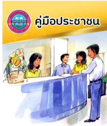
เทศบาลตำบลลี้มิ่ง อำเภอเมืองลำพูน จังหวัดลำพูน